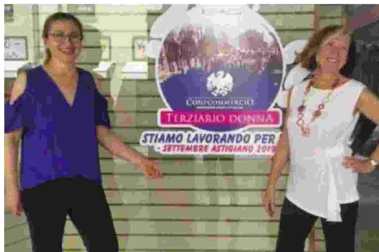
LE RESPONSABILI DEL GRUPPO TERZIARIO DONNA DI ASCOM CONFCOMMERCIO

Dopo le “Vie in movimento” sta prendendo forma una nuova iniziativa di Terziario Donna - Confcommercio per promuovere e valorizzare il Settembre astigiano.